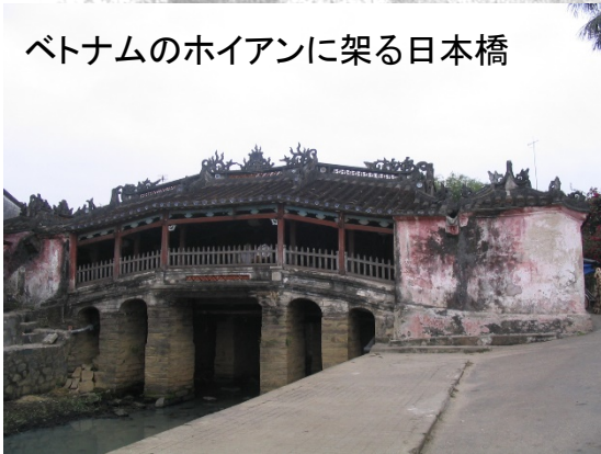
ベトナムのホイアンに架る日本橋